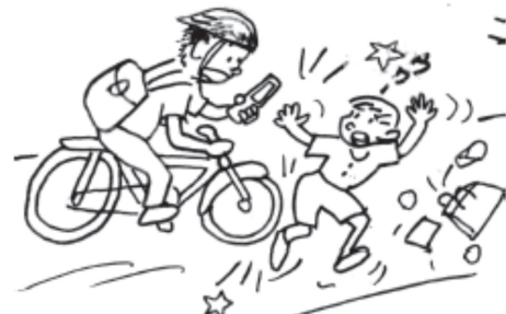
携帯電話等の使用運転禁止