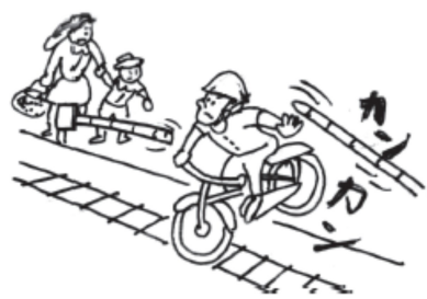
しゃ断踏切立入り禁止