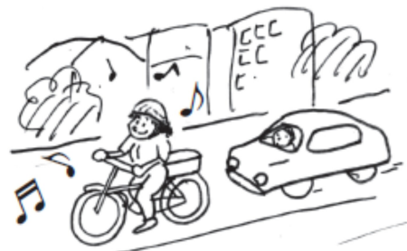
イヤホン等の使用運転禁止