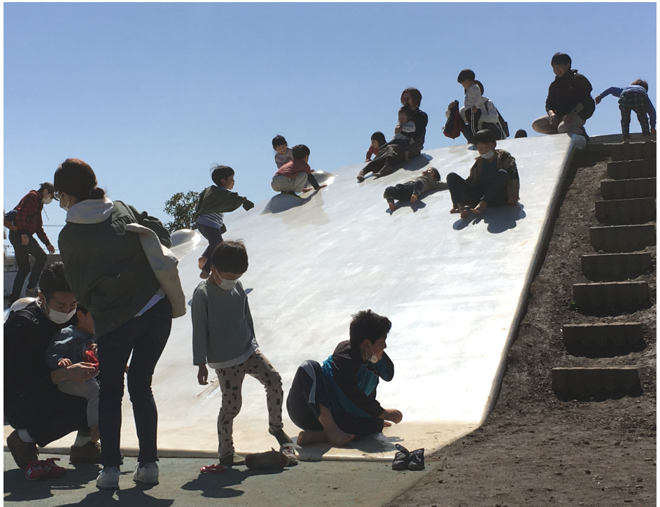
つるせ西ゆうゆうの丘公園