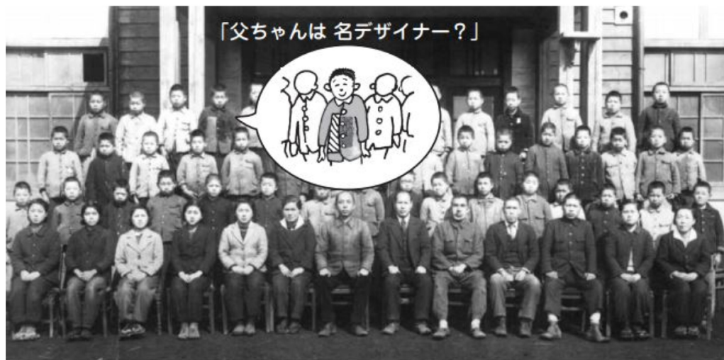
鶴瀬小学校6年卒業記念写真 昭和20年(1945年)3月

今回特集の私の捨てられない物とは、この時の記憶にある黒い布をかぶって撮影していたものと同様のカメラです。当時は戦時中でしたので食料は少なく代用食などという粗末なものでしたが、何を食べてもおいしかった記憶があります。衣服なども兄弟のお下がりや古い着物を再利用したり、当時はいろいろな知恵を働かせていました。私の服装は長く残る記念写真だからと、親が一帳羅のものを着せてくれたのだと思いますが、上着はデザインではなく、きぼはきぼのものだったんです。いろいろな布切れを集め親父が仕事で使うミシンを使い縫い合わせたものでした。このミシンは難波田城公園の古民家の中に展示されています。そちらを見ても昔のことを思い出させてくれます。ボケ防止の意味も含め、これからも捨てられないものからいろいろなことを思い出し出してみたいと思っています。