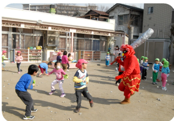
赤鬼きたよ。やっつけろ～! (市立第6保育所)