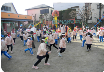
元気な子鬼でいっぱい! (銀の鈴幼稚園)