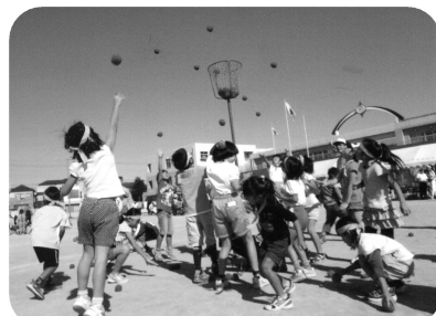
思いっきりジャンプ!(つるせ台小学校区)