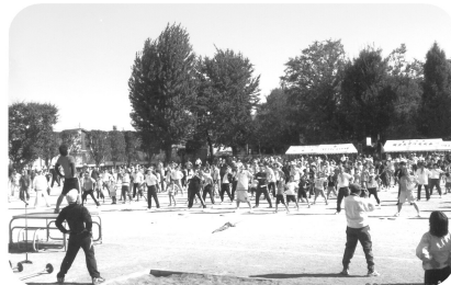
みんなで準備体操(関沢小学校区)

10月13日(日)青空の下、地区体育祭が開催されました。どちらの会場も参加者の歓声のなか、子どもからおじいちゃんおばあちゃんまで一緒に競技を楽しみました。