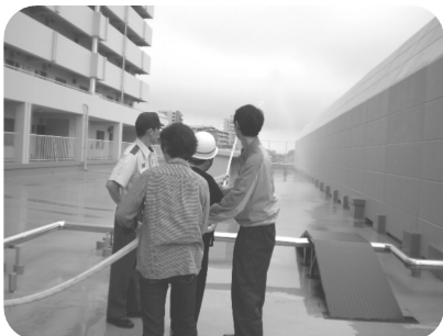
放水訓練にも挑戦(サンライトマンション)

鶴瀬駅上のサンライトマンションでは、住人と駅ビルで働く人たちが協力して毎年実施されています。また、つるせ台小学校校庭で行われた訓練には、はしご車も出動して子どもたちは大喜びでした。