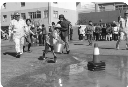
バケツリレーでそれ!(鶴瀬西・上沢地区社協)