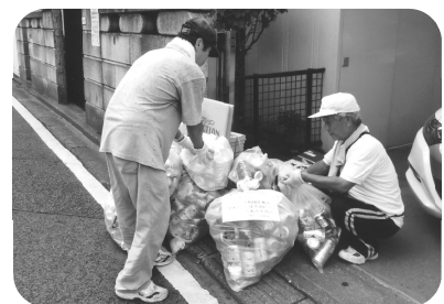
よしよし、たくさん集まった