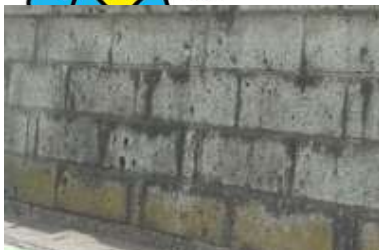
大谷石（組積造の塀）