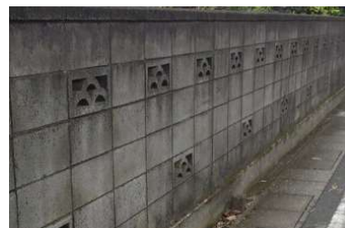
コンクリートブロック塀