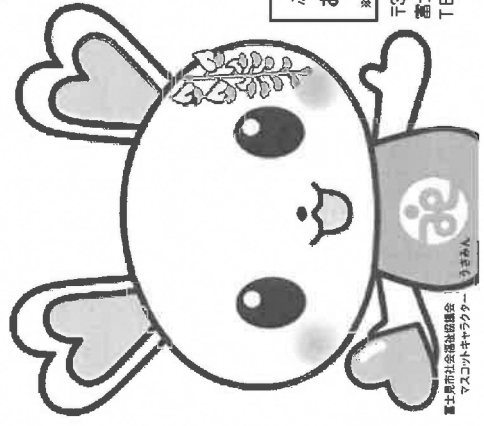
富士見市社会福祉協議会 マスコットキャラクター「あひちゃん」