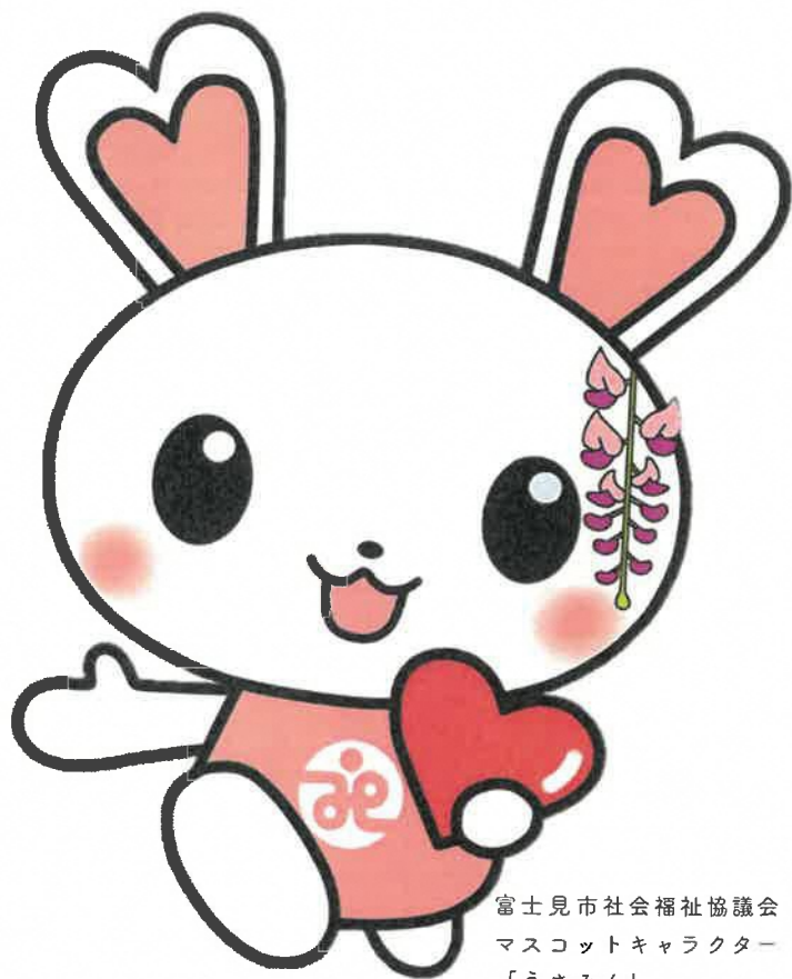
富士見市社会福祉協議会 マスコットキャラクター 「うさみん」