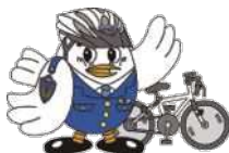
埼玉県警察マスコット 「ポッポくん」

※3 自転車を運転するときは、自転車のハンドル、ブレーキその他の装置を確実に操作し、かつ、他人に危害を及ぼさないような速度と方法で運転しなければなりません。