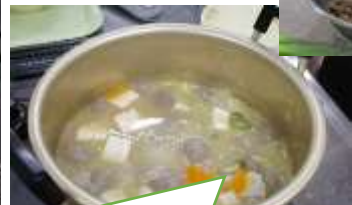
16日(金) 世界一おいしいつみれの味噌汁