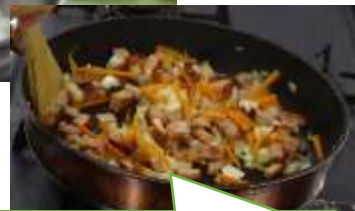
20日(火) にらましきムチごはん