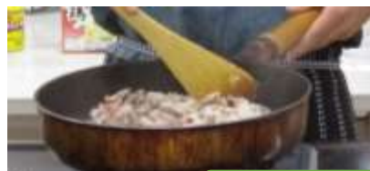
臭だくさん! トマトスープ