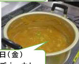
30日(金) チーズ in カレー