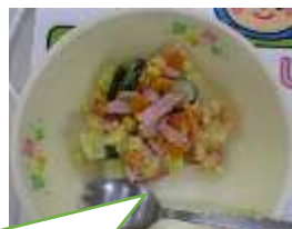
27日(火) 色どり満点ホットポテトサラダ