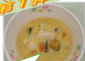
23日(金) 臭だくさん クリームシチュー