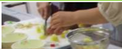
ルーも手作りしました。