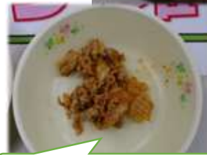
ピリ辛キムチビビンバ