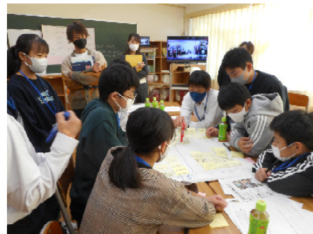
中学校区ごとの話合い