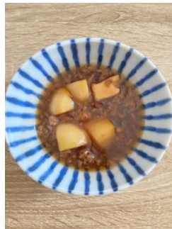
市内産「かぶ」入り かぶとひき肉の トロトロあんかけ