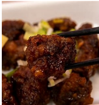
鯨肉の甘酢あんかけ (イメージ)