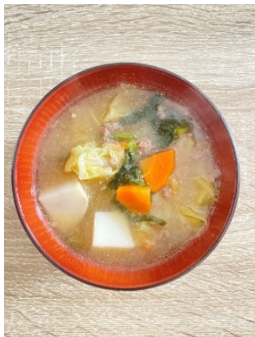
市内産「小松菜」入り 野菜たっぷり味噌汁

(2) メニュー：ごはん、牛乳、野菜たっぷり味噌汁、かぶとひき肉のトロトロあんかけ、れんこんの彩りサラダ、富士見いちごゼリー