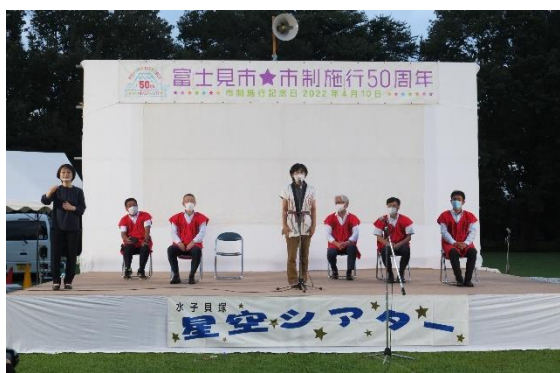
実行委員長あいさつ