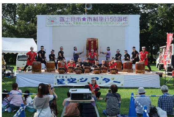
ステージ発表（富士見太鼓）

また、映画上映前には市制施行50周年のPR動画を上映したほか、ららぽーと富士見を第2会場として同日同時刻に同作品（「ペット2」）を上映した（鑑賞者約150人）。