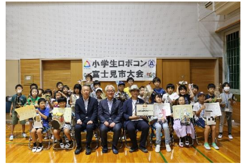
【閉会式後の集合写真】