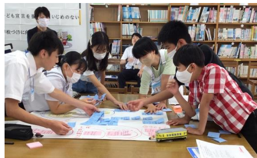
【中学校区ごとの話し合いの様子】

「お互いの違いを認め合い、相談しやすい環境をつくる」、「ポスター等の掲示物をつくって、いじめをなくすよう呼びかける」など、子ども会議で決まった『いじめをなくすための取組』について、各学校で実践する。また、実践による成果について、来年度の会議で報告する。