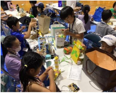
【ロボットの最終チェック】