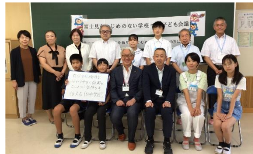
【鶴瀬小会場での集合写真】

市内小中学校の代表が中学校区で集まり、各会場をオンラインで結んで、いじめのない学校づくりについて話し合った。