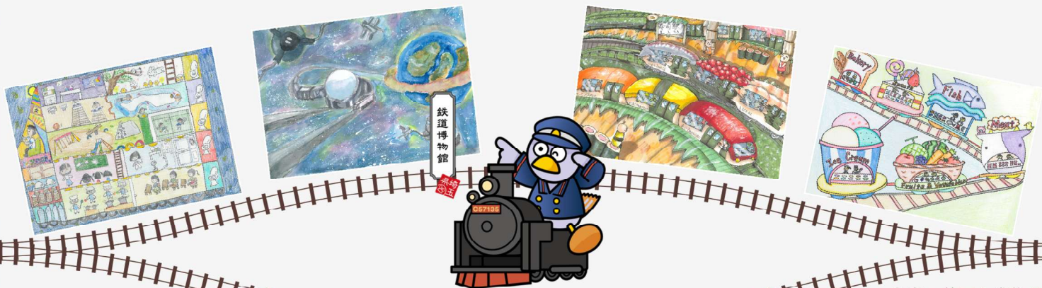
埼玉県のマスコットコバトン