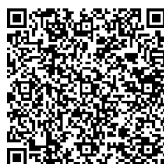
パパママ準備教室動画