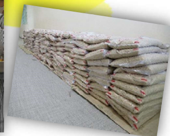
<たくさんのお米の寄附>