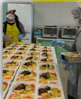
<子ども食堂のお弁当づくり>