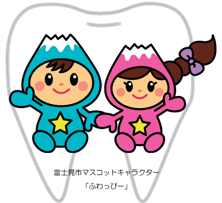
富士見市マスコットキャラクター 「ふわっぴー」

歯とお口の健康は、食事や会話など、日々の生活を豊かにするために欠かせないものであり、生涯にわたって心身の健康を保つ上で重要な柱となっています。