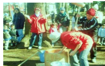
力が入ります。公園広場でのお餅つき

するまでには、材料の下準備等大変ご苦労なものがあります。厳寒の野外、足元は悪く、水道は凍結していて、地域の町会長さんのお世話になったりと、アクシデントはあったものの、参加した子どもたちは母親に助けられて元気よく杵を振りおろしていました。出来上がったばかりの餅を頬張る子どもたちは「ぼくがついた餅だよ」と言わんばかりのようです。親も子も、近所の人職員も一体となって楽しさを分かち合えることは、なんと素晴らしいことかを実感しました。またスタッフの皆さんのご苦労もよく理解できた1日でした。(横田・記) 😊