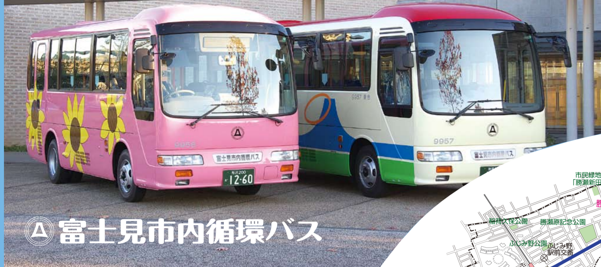
富士見市内循環バス